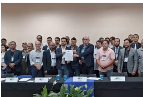
Divisão no Coridoce